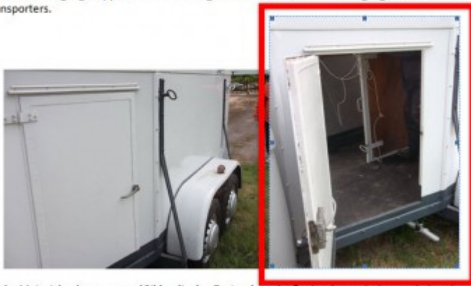
Etlche Materialrechnungen und Bilder die den Zustand vor der Restaurierung belegen, sind noch

Wiederhole diese Arbeitsschritte mit allen Bildern die auf die gleiche Art bearbeitet werden müssen.