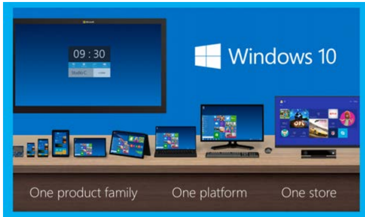
Windows 10: Gameplay aufnehmen