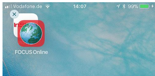
Screenshot Durch das Übereinanderschieben der Apps entsteht ein Ordner