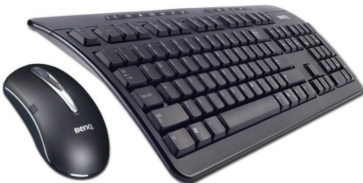
Mit Maus und Tastatur zoomen